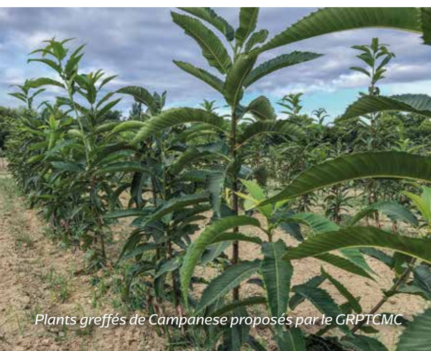
Plants greffés de Campanese proposés par le GRPTCMC

104 Exploitants agricoles habilités en AOP Farine de Châtaigne Corse - Farina Castagnina Corsa