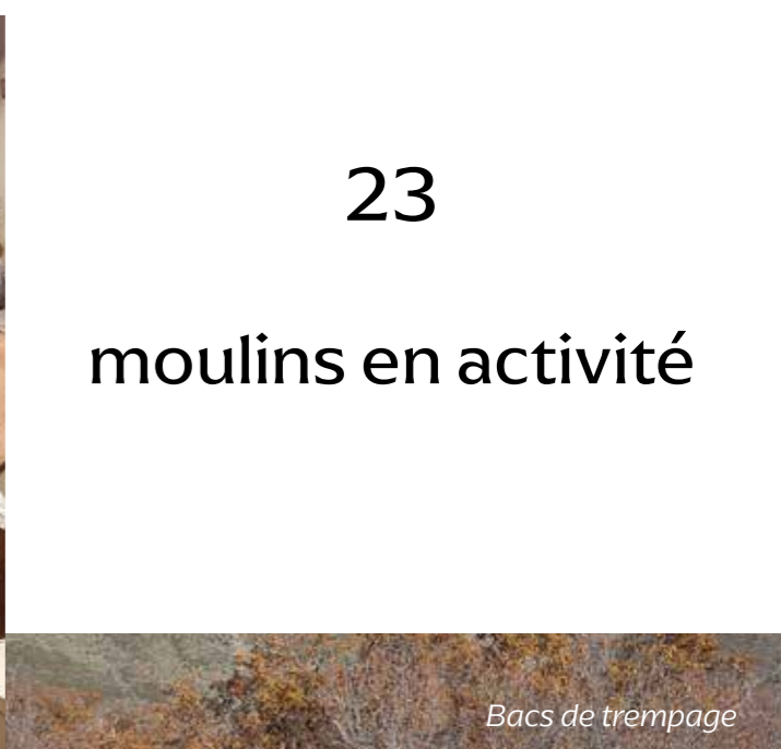
Bacs de trempage

2010, 110 tonnes de Farine de châtaigne sous AOP