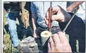
Le greffage permet notamment de multiplier une ou des variétés intéressantes pour leurs qualités gustatives.

midie. Sans oublier quelques autres dispositions, comme le nettoyage des outils et la protection du point de greffe par un cicatrifiant adéquat. « La Corse ne compte pas moins de 40 variétés de châtaignes adaptées à la transformation en farine, c'est-à-dire des fruits à bonne déhiscence, très sucrés. Mais, certaines variétés bien typiques sont en train de disparaître, car les méthodes de régénération ne sont plus utilisées. Aussi l'objectif