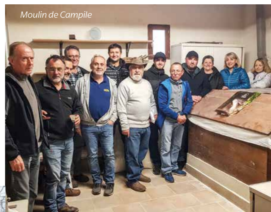
Moulin de Campile