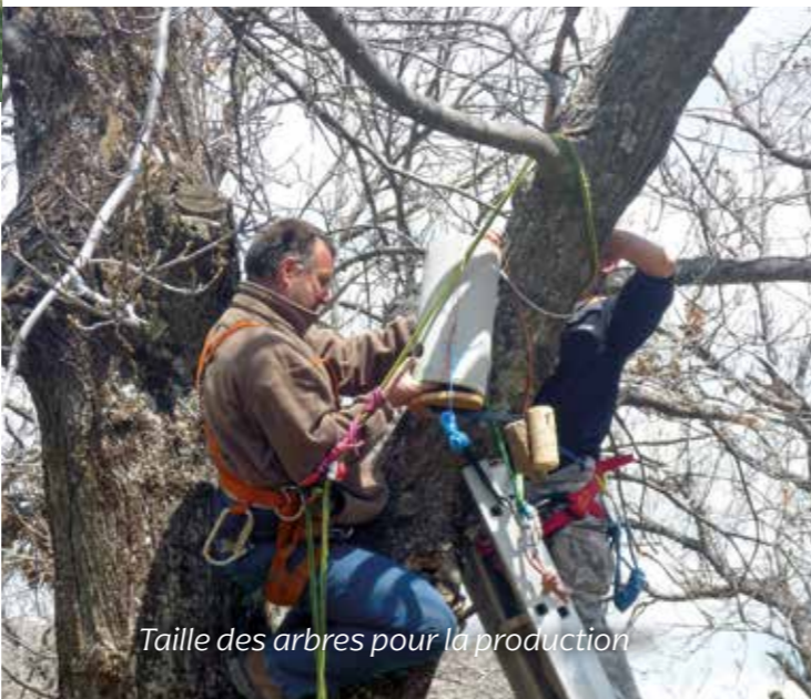
Taille des arbres pour la production

104 Exploitants agricoles habilités en AOP Farine de Châtaigne Corse - Farina Castagnina Corsa