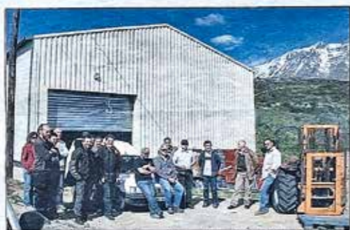
Les journées d'information consacrées au greffage mises au point par le Groupement régional des producteurs de châtaigne visent à sensibiliser un large public à une méthode de régénération en cours...

C'est un geste à la fois technique et porteur d'espoir pour la châtaigneraie. Aux mois d'avril et de mai, le vif va-et-vient entre de plain-pied dans une période propice au greffage de châtaigner. Une pratique que le Groupement régional des producteurs et transformateurs de châtaignes et marrons de Corse s'efforce de promouvoir. Raison pour laquelle, il propose chaque année des journées d'information destinées à un large public : producteurs, simples passionnés ou stagiaires du Centre de promotion sociale de Corte, en collaboration avec les deux chambres départementales d'agriculture. Cette année, trois de ces journées ont été mises en place dans différentes régions castanicoles, à savoir le Niolu, la Castagniccia et la Giavonica. Au programme : la technique de la greffe en couronne, utilisée traditionnellement, mais aussi la greffe en fente ou en fûtée... L'objectif du greffage est de pousser multiplier une ou des variétés de châtaignes intéressantes pour leurs qualités gustatives, et leur adaptation aux techniques de transformation en farine, en confiserie ou pour une valorisation de la châtaigne de bouche... précise Pascal Flori, le président du groupement régional. Mais, pour que l'opération réussisse, quelques règles essentielles doivent être respectées. Notamment en ce qui concerne le choix des greffons et la période de prélèvement, idéalement en levrier, puis leur stockage en milieu frais et ha-